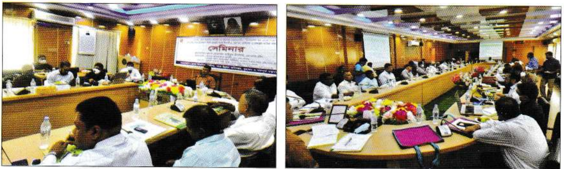
চিত্র-২: সেমিনারে উপস্থিতির স্থির চিত্র।