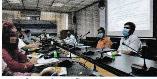
ছবিঃ প্রশাসনিক দূরদর্শীতা এবং গৃহায়ণ বিষয়ক ভাবনা শীর্ষক আলোচনা সভার স্থির চিত্র

গ্রাম, আমার শহর' শীর্ষক কর্মসূচি গ্রহণ করা হয়েছে। একই সঙ্গে পদ্মা সেতু রেল সংযোগ প্রকল্প, চার লেন মহাসড়ক, এলিভেটেড এক্সপ্রেসওয়ে, পানগাঁও নৌ-টার্মিনাল নির্মাণ প্রকল্প, গ্যাস সংকট নিরসনে এলএনজি টার্মিনাল প্রকল্প, মেট্রোরেল প্রকল্প, রূপপুর পারমাণবিক বিদ্যুৎ প্রকল্প, রামপাল কয়লাভিত্তিক বিদ্যুৎ প্রকল্প, গভীর সমুদ্রবন্দর নির্মাণ, মাতারবাড়ী বিদ্যুৎ প্রকল্প, পায়রা সমুদ্রবন্দর, রাজধানীর চারপাশে স্যুরারেজ ট্যানেল নির্মাণের মতো হচেছে। বাংলাদেশ নিজেকে সর্বাধিক উন্নত তুলতে ডেল্টা পরিকল্পনা-বাংলাদেশ ইতোমধ্যে উন্নীত হয়েছে। দেশের মর্যাদায় অভিষিক্ত জাতির দৃষ্টি নিবদ্ধ রয়েছে আমরা দৃঢ়ভাবে আস্থা