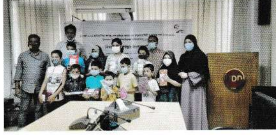
ছবিঃ পুরস্কার বিতরণী, শিশু চিত্রাঙ্কন প্রতিযোগিতা, ২০২১

বঙ্গবন্ধু শেখ মুজিবুর রহমান এর জন্মশতবার্ষিকী উপলক্ষে নগর উন্নয়ন অধিদপ্তর বিভিন্ন কর্মসূচী গ্রহণ করেছে। স্বাধীনতার মহান স্থপতি জাতির পিতার প্রতি সর্বোচ্চ সম্মান প্রদর্শনপূর্বক এবং তার বর্ণাঢ্য কর্ম জীবন সম্পর্কে নতুন প্রজন্মকে পিতার আদর্শে উদ্বুদ্ধকরণের লক্ষ্যেই ১৭ মার্চ ২০২১ তারিখে জনক বঙ্গবন্ধু শেখ মুজিবুর রহমান এর জন্ম শতবার্ষিকী ও জাতীয় শিশু দিবস ২০২১ উদযাপন উপলক্ষে “বঙ্গবন্ধুর বাংলাদেশ” বিষয়ে শিশু নগর উন্নয়ন অধিদপ্তরের ২০২১ তারিখে সকাল আয়োজন করা হয়। প্রতিযোগীগণ ৩ টি গ্রুপে বছর, খ-গ্রুপঃ বয়স ৮-বয়স ১০-১২ বছর) উন্নয়ন অধিদপ্তরে কর্মরত